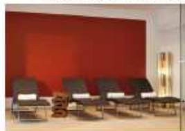
Ruheraum in der Saunalandschaft