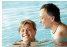
Wassertherapie und Aquafitness