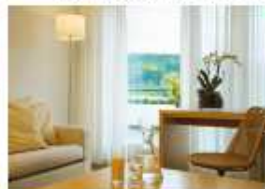
Zimmer mit herrlichem Ausblick