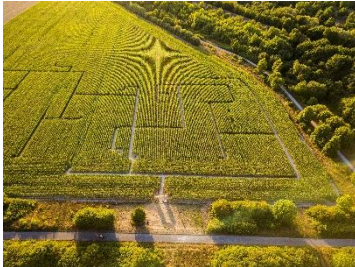
Maislabyrinth am Kronsberg vom Brandes Hof in Hannover.

Hamburg/Niedersachsen, 31. August 2022. Im Spätsommer werden eine Menge Maisfelder in Niedersachsen zum Abenteuerspielplatz: Maislabyrinth laden jetzt Groß und Klein zu einer spannenden Entdeckungstour mit viel Verirr-Spaß auf dem Land ein. Während man sich vom Boden aus den Weg durch das grüne Dickicht sucht, guckt man von oben auf echte Kunstwerke, denn viele Maisfelder sind nach besonderen Motiven gestaltet. Einige Landwirte bieten zusätzlich ein