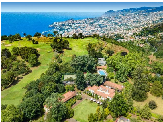
Der aktuelle Deal der Woche: „Relaxtage“ im Casa Velha do Palheiro***** auf Madeira.

Frankfurt, 22. August 2022. In Funchal, der Hauptstadt Madeiras, liegt das gehobene Casa Velha do Palheiro***** . Das ehemalige Jagdhaus aus dem 18. Jahrhundert ist eingebettet in die preisgekrönten Palheiro-Gärten. Den Gästen stehen 33 Zimmer und fünf Suiten zur Verfügung. Auf dem 120 Hektar großen Anwesen befindet sich unter anderem das „Palheiro Spa“ und ein Championship-Golfplatz. Das Hotel ist Mitglied in der „Relais