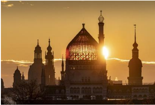
Die ehemalige Zigarettenfabrik Yenidze in Dresden ist einer der neuen Insta-Hotspots in 2022.

Hamburg, 28. März 2022. Wer dachte, dass man immer nur in ferne Länder reisen muss, um die schönsten Orte zu entdecken, wurde in den letzten zwei Jahren eines Besseren belehrt. Corona beflügelte den Trend zum Urlaub im eigenen Land und „Good old Germany“ konnte sich als facettenreiches Reiseland beweisen. Wie schön die Heimat ist, wurde auf Instagram, Facebook, Pinterest und Co. eindrucksvoll in Szene gesetzt –