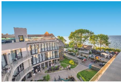
Kurhaus Max.

Morskie nahe Kolberg ist ein modernes und familiär geführtes Gesundheitshotel, nur wenige Meter vom Strand entfernt. Die hoteigene Kurabteilung bietet eine Spezialtherapie und weitere wirksame Behandlungen bei Rückenproblemen. Zum Einsatz kommen dabei beispielsweise Physiotherapien mit Massagen, CO 2 - oder Solebäder, Moorpackungen, Magnetfeldtherapien oder