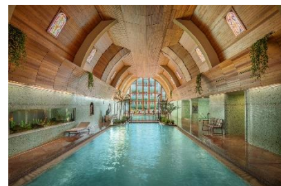
NaturMed Hotel Carbona****s.

Rund 1.500 Heilquellen, aus denen mineralhaltiges Thermalwasser fließt, machen Ungarn zu einer der Kurdestinationen Europas. Im bekannten Kurort Bad Hévíz, der mit seinem weltweit größten natürlichen Thermalsee jährlich viele Gesundheitsurlauber zu sich lockt, bietet das NaturMed Hotel Carbona****s ein