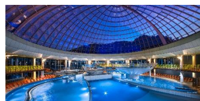
Therme des Hotels Thermiana Park Laško*****.

Auch Slowenien ist für seine vielen Thermalquellen bekannt. Das Hotel Thermiana Park Laško***** mit angeschlossenem Thermalzentrum liegt in ruhiger Lage am Flussufer der Savinja in Laško, im Nordosten des Landes. Die Heilwirkung des hiesigen Thermalwassers ist seit Jahrzehnten bekannt. Mit einer angenehm warmen Temperatur lindert das Laško-Thermalwasser Schmerzen und macht den Bewegungsapparat geschmeidig. Es ist auch als Trinkkur anwendbar. Gästen des Hotels steht ein Trinkbrunnen zur Verfügung.