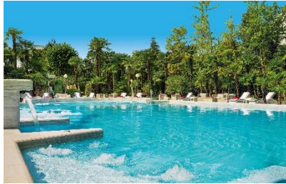
Abano Grand Hotel*****D. ©fitreisen.de

Ein luxuriöses Reiseziel für eine Rückentherapie bietet Abano Terme, das älteste Thermalzentrum Europas. Gelegen in Norditalien, inmitten der Euganeischen Hügel, ist die Region für das hiesige Thermalwasser und den Fangoschlamm bekannt. Diese beiden natürlichen Heilmittel werden zur Schmerzlinderung sowie Stärkung der Muskeln und Gelenke eingesetzt. Der reife Fango des