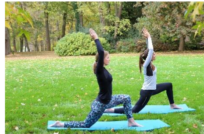
Gesundheitshotel Miraverde EurothermenResort****.

Bad Hall im oberösterreichischen Voralpenland bietet Europas stärkste Jodsole-Quelle. Jodsole ist ein natürliches Heilwasser, das seit der Antike zur Gesundheitsvorsorge und bei bestimmten akuten Beschwerden als Therapie angewandt wird. Verabreicht wird es als Trinkkur, in Bädern, zur Inhalation oder in Form von Packungen. Besonders wohltuend ist die Jodsole bei Augenerkrankungen, aber auch für den