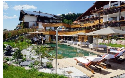
Biohotel Eggensberger****.

Entschleunigung und Achtsamkeit in der Natur: Das familiengeführte und zertifizierte Biohotel Eggensberger**** bietet eine sonnenverwöhnte Panorama-Lage nahe am Ufer des Hopfensees im Allgäu. Die Gastgeber-Familie verfolgt ein rundum gesundes und ökologisches Hotelkonzept mit regionalen Produkten in der Bio-Küche, Natur-Zimmern oder nachhaltigem Wellnessbereich. Der Garten-Spa bietet einen Natur-Swimmingpool, Holzdecks mit Liegen und einen Naturgarten mit Duftpflanzen.