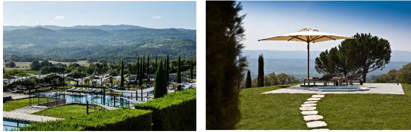
Coquillade Provence Resort & SPA*****.

Im Herzen eines 36 Hektar großen Weinanbaugebiets inmitten der Provence bietet das Coquillade Provence Resort & SPA***** unter deutschsprachiger Leitung ein exklusives Outdoor-Spaerlebnis. Mit viel Liebe zum Detail wurden mehrere historische Gehöfe restauriert und eine besondere Wohlfühlatmosphäre geschaffen. Das hoteleigene Spa- und Wellnesscenter wurde 2018 mit dem World Luxury Spa Award ausgezeichnet. Zwei beheizbare Außenpools mit Liegen und Sonnenschirm, Außenwhirlpools sowie Plätze für Yoga, Qi-Gong und Meditation sind für Tiefenregeneration geradezu prädestiniert.