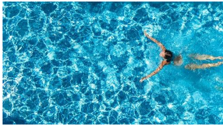
Fit Reisen zeigt, wo das Wellnesen unter freiem Himmel am schönsten ist.

Frankfurt, 24. August 2021. Die Welt ist entspannungsreif! Nicht erst seit der Pandemie fühlen sich viele Menschen durch Stress auf der Arbeit und Hektik im Alltag ausgebrannt. So wächst die Sehnsucht nach einer tiefenentspannenden Atempause immer mehr und der Gesundheitstourismus entwickelt sich zum boomenden Trend. Coronakonform locken immer mehr Hotels mit exklusiven Rund-um-Wohlfühloasen