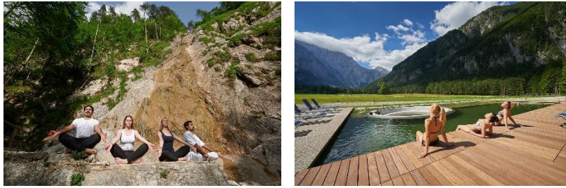
Hotel Plesnik****.

Im Herzen des slowenischen Regionalparks Logar-Tal gelegen, genießen Gäste des Hotels Plesnik**** eine grüne Landschaft und einen malerischen Blick auf die Kamniker Alpen. Wellness mit Eco-Gedanken gibt es hier in Form von Entspannung am und im Panorama-Außenpool, Ayurveda, Outdoor-Yoga, Wandern oder Radfahren. Auch Klettern, Kajakfahren oder ein Ausflug zum Wasserfall geben Geist und Körper neue Power.