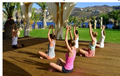
Out of the Blue Capsis Resort*****D.

Das Out of the Blue Capsis Resort*****D in Agia Pelagia auf Kreta ist umgeben von einem üppigen botanischen Garten mit prachtvoller Pflanzenwelt. Outdoor-Wellness und -Fitness stehen hier täglich auf dem Programm. Besonders exklusiv ist der weite Panoramablick über das Ägäische Meer, der den Alltag ganz schnell vergessen lässt.