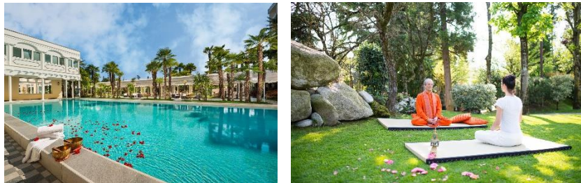
Hotel Terme Metropole*****.

Der international bekannte norditalienische Kurort Abano Terme gilt als Europas ältestes Thermalzentrum mit Thermalwasserquellen und heilendem Fangoschlamm. Hier punktet das Hotel Terme Metropole***** , ein Mitglied der GB Hotels-Kette, mit drei Thermalaußenpools, klassischen und orientalischen Fangoanwendungen sowie Thermal Spa für Beauty und Healthness. Inmitten eines rund 33.000 Quadratmeter großen Parks am Rande des Ortszentrums finden man hier viel Platz für achtsames Relaxen und Yogasessions im Grünen. Ideal gelegen in den Euganeischen Hügeln bieten sich von hier auch Ausflüge nach Venedig, Verona oder Padua an.