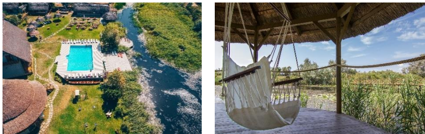
Green Village Resort****.

Fernab vom Alltagsstress, inmitten von Seen und Auenwäldern, bietet das Green Village Resort**** in der rumänischen Ortschaft Sfântu Gheorghe am südlichsten Arm des Donaudeltas mit direkter Lage zum Schwarzen Meer ein Hideaway für Naturliebhaber. Die Anreise zu der Unterkunft im UNESCO-Naturschutzreservat erfolgt per Boot. Dort angekommen sorgen Außenpool und Außenwhirlpool sowie viele Entspannungsplätze im Grünen für neue Energie.