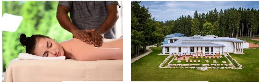
Resort Svatá Kateřina****.

Das Resort Svatá Kateřina**** im Tschechischem Hochland lädt zu Ayurvedamassagen und Yoga unter freiem Himmel ein. Eingebettet zwischen Wäldern und Lichtungen bietet das Resort eine autofreie Zone mit viel Ruhe und klarer Luft zum Durchatmen. In Kooperation mit der Kairali Ayurvedic Group aus Indien ist hier ein traditionelles Ayurvedacenter mit Ayurveda-Pavillon entstanden, der in ruhiger Waldlage mit einer Sonnenterrasse sowie einem ayurvedischen Meditationsgarten mit Wasserfall lockt.