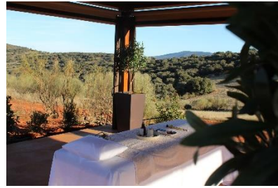
Hotel La Caminera Club de Campo*****.

Eine echte Wellness-Überraschung bietet das Hotel La Caminera Club de Campo***** in Torrenueva, einem Teil der Quijote- und Weinstraßen in Südspanien. Der Olivenbaum spielt im hauseigenen Elaiwa-Spa eine wichtige Rolle. So wurde hier das originelle Konzept des „Olivenöl-Spa-Sommeliers“ entwickelt. Das individuelle Verwöhnprogramm beginnt für Gäste mit einer Verkostung verschiedener Olivenölsorten, die auf dem Gut hergestellt werden. Im Anschluss folgt die Olivenöl-Massage nach den persönlichen Vorlieben und Bedürfnissen. Später gehts zum schicken Außenpool mit Liegen und weitem Landschaftsblick.