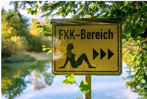
Hier geht's zum FKK-Bereich.

Leipzig, 07. Juli 2021. Österreicher lieben das sonnen und baden ganz ohne Bekleidung. Was in den 1920er-Jahren so hüllenlos begann, hat der Nation im Jahr 2016 sogar den Titel als FKK-Weltmeister beschert. Laut einer Umfrage eines Online-Reisebüros soll jeder dritte im Land dem Naturismus nicht abgeneigt sein. In welcher