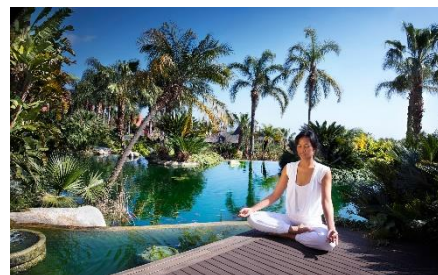
Asia Gardens Hotel and Thai Spa*****.

Als Mitglied der Leading Hotels of the World und der Royal Hideaway Luxury Hotels of the World präsentiert sich das Asia Gardens Hotel & Thai Spa***** als exklusive Unterkunft südlich von Valencia an der Costa Blanca. Im Garten finden Gäste eine natürliche Umgebung mit mehr als 200 verschiedenen Baum- und Pflanzenarten. Circa 80 Prozent der vielfältigen Flora stammt aus Asien. Die Rasenfläche des Hotels erstreckt sich auf mehr als 10.000 Quadratmetern, die rund 900 Kilogramm CO 2 pro Jahr absorbiert und ausreichend Sauerstoff für 170 Personen pro Tag produziert. Neben fünf großzügigen Außenpools ist ein Wellness-Highlight der Thai-Spa: Hier praktizieren thailändische Therapeuten von der thailändischen Massage-Schule Wat Pho aus Bangkok traditionelle Massagetechniken. Diese basieren auf 2.500 Jahre alter thailändischer