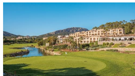
Steigenberger Golf & Spa Resort*****.

Eine Auszeit in entspannter Lage, umgeben von der Küstenlandschaft Mallorcas und direkt am exklusiven Golfplatz „Golf de Andratx“: Das Steigenberger Golf & Spa Resort***** lädt zu einer entschleunigenden Auszeit mit einem rund 1.400 Quadratmeter großem Wellness-Spa und Wohlfühlprogrammen in luxuriöser Atmosphäre ein. Gäste vergessen den Lockdown-