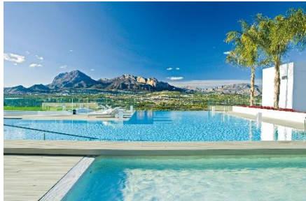
Sha Wellness Clinic*****.

Für luxusliebende Health- und Wellnessfans ist die Sha Wellness Clinic***** im spanischen Küstenort Altea, in der Nähe von Alicante, die Topadresse. Als großzügig angelegtes Design-Resort im Naturpark mit weiter Aussicht werden hier die neusten Programme rund um Medical Wellness-Therapien – von Rebalance bis hin zu gesundem Schlaf oder Darmgesundheit – angeboten. Ein Spa-Bereich auf rund 6.000 Quadratmetern, moderne makrobiotische Ernährung, Schönheitsmedizin, sowie individuelle Aktivprogramme sind nur einige Specials, die die Gäste hier bei ihrer Gesundheitsauszeit erwarten. Beim Fit Reisen-Paket „ Fit Tipp: Sha Rebalance “ ab vier Nächten in der Suite mit personalisierter Sha-Vollpension-Diät und Getränken laut Ernährungsplan sind außerdem unter anderem inklusive die Ernährungsberatung, revitalisierende medizinische Konsultation, Tiefen- oder Relaxmassage, Wassertherapie-Sitzung, Yoga, Mindfulness, Pranayama-Atmungstechniken sowie Fitness mit einem Personaltrainer ab 2.500 Euro pro Person.