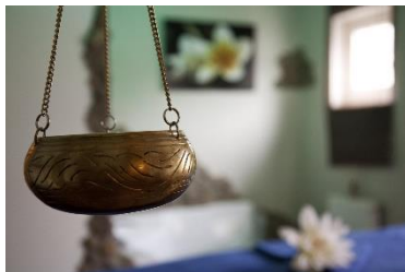
Ayurvedakur im Ayubowan Ayurveda Center.