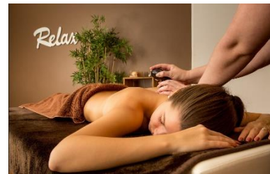
„Time-out“ in der Privatlinik Schloss Warnsdorf.

Stilvolle Schlossauszeit mit medizinischem Fokus unweit der Lübecker Bucht an der Ostsee: Die Privatlinik Schloss Warnsdorf ist eine der etabliertesten Fastenkliniken Norddeutschlands und ein anerkanntes privates Gesundheitsresort für Heilfasten, Naturheilverfahren und ganzheitliche Medizin. Neben wirksamem Fastenprogrammen mit ärztlicher Begleitung, fokussiert sich