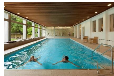
Fasten und Entspannung in der Malteser Klinik von Weckbecker.