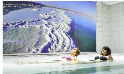
Solebad in der Tomesa Fachklinik.

Speziell für Erholungsuchende mit Hautleiden stehen die Türen der Tomesa Fachklinik in Bad Salzschlirf offen. Bereits seit 1982 fokussiert sich das Haus mit Ärzten und Therapeuten unterschiedlicher medizinischer Disziplinen auf dermatologische Reha-Maßnahmen. Ziel der individuellen Behandlungen ist, das Hautbild des Patienten nachhaltig zu verbessern, die damit einhergehenden physischen und seelischen Belastungen zu lindern und den Umgang mit der Erkrankung zu schulen. Darüber hinaus bietet Tomesa weitere Kurprogramme zu Medical Wellness, Ayurveda, Burn-Out-Prävention oder Schlafstörungen.