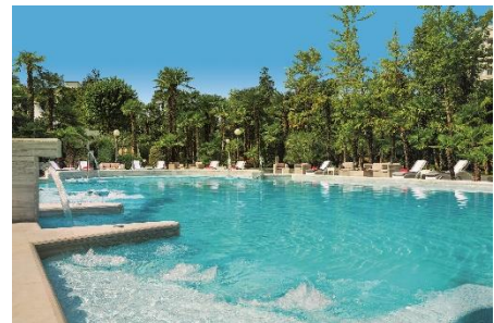
Abano Grand Hotel*****D.

Bei chronischen Muskel- und Gelenkschmerzen hilft auch eine Wärmetherapie mit Fango. Die Wärmepackungen mit dem Mineralschlamm liegen bei etwa 45 bis 50 Grad Celsius 20 bis 40 Minuten lang auf den erkrankten Körperstellen. Bei Rheuma wirkt die Therapie durchblutungsfördernd, entspannend und schmerzlösend. Als bedeutendster Kurort für Fangotherapien in Europa gilt Abano Terme, knapp 60 Kilometer von Venedig entfernt. Die umliegenden Euganeischen Hügel sind vulkanischen Ursprungs mit Thermalquellen, dessen Heilwasser vor allem für die Herstellung des berühmten Fangoschlammes genutzt wird.