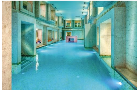
Entspannung finden in der Rimske Terme****.

Das Fibromyalgiesyndrom (FMS), früher auch als Weichteilrheuma bezeichnet, ist eine häufig auftretende chronische Schmerzerkrankung, die in mehreren Körperregionen auftritt. Als Begleitsymptome können Müdigkeit, Schlafstörungen und psychische Belastungen auftreten. Die genauen Ursachen für diese Erkrankung sind bis heute nicht bekannt, bestimmte Faktoren wie Stress oder Übergewicht können FMS aber begünstigen.