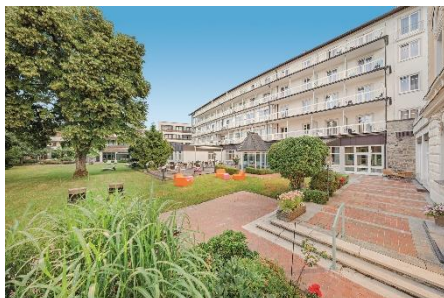
Das von Sebastian Kneipp gegründete Sebastianeum.

Als klassisches Naturheilverfahren zur Schmerzlinderung bei Rheuma dient ebenfalls die Lehre des Naturheilkundlers Sebastian Kneipp. Seine Behandlungsform kombiniert die Wirkung von Heilpflanzen mit Wasseranwendungen sowie Ernährungs- oder Bewegungstherapien. Sowohl Wirkstoffe bestimmter Pflanzen sowie Wassertherapien, zum Beispiel in Form von warmen und kalten Bädern, Güssen oder Wickeln, lösen positive Reaktionen im Körper aus, wirken schmerzlindernd und entzündungshemmend.