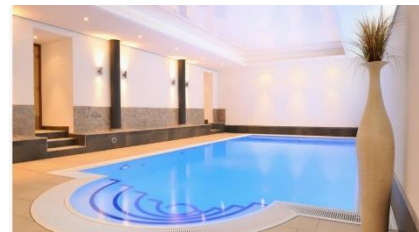
Dappers Hotel****.

Dappers Hotel**** : Ein umfangreiches Spa-Angebot, die unmittelbare Nähe zur örtlichen KissSalisTherme und Romantik-Arrangements für Paare zeichnen das Dappers Hotel**** in Bad Kissingen aus. Besonders von den KMW-Gästen gelobt werden hier die luxuriöse Ausstattung sowie die Herzlichkeit des Personals. Auch die Drei-Gang-Verwöhn-Menüs mit wechselnder Cuisine sind ein beliebtes Feature des Hauses.