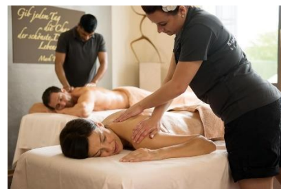
Apartmenthotel New Angela.

Apartmenthotel New Angela : Das Apartmenthotel New Angela in Bad Kissingen ist Teil des Dappers Hotels und sorgt mit kuschligen kleinen Apartments für private Atmosphäre, was besonders bei KMW-Flitterwöchlern gut ankommt. Mit Specials wie dem Cleopatrabad oder dem Rhöner Bierbad kommen Wellness-Fans hier voll auf ihre Kosten. Auch mit der