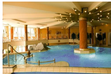
Thermenhotel Viktoria****.

Thermenhotel Viktoria**** : Ebenfalls in Bad Griesbach gelegen gehört auch das Thermenhotel Viktoria**** zu den besten Wellnesshotels in Bayern. Ein Aufenthalt steht hier ganz im Zeichen des heilenden Thermalwassers aus der lokalen St. Nikolaus Quelle, das die Gäste im großzügigen Spa-Bereich genießen können und als lindernde Wirkung