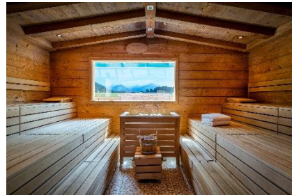
Best Western Plus Hotel Erb****.

Best Western Plus Hotel Erb**** : Hochmodern ist der neue Wellnessbereich „Almdorf“ im Best Western Plus Hotel Erb**** in München-Parsdorf. Das elegante Haus beeindruckt die KMW-Kunden außerdem mit seiner vielseitigen Gastronomie von bayerischen Spezialitäten bis zu Köstlichkeiten vom original spanischen Jospier-Grill. Auch die Nähe zur Münchner Innenstadt und der bekannten Therme Erding machen das Best Western Plus Hotel Erb**** zu einem der Award-Gewinner.