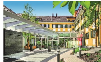
La Pura Women's Health Resort****s.

Europas einziges Gesundheitsresort nur für weibliche Gäste – genau damit punktet das La Pura Women's Health Resort****s in Gars am Kamp. Basierend auf den neusten Erkenntnissen der Gender-Medizin erschafft das Ärzte- und Therapeutenteam einen Kraftort für Frauen, die viel Wert auf einen gesunden Lebensstil sowie eine besondere