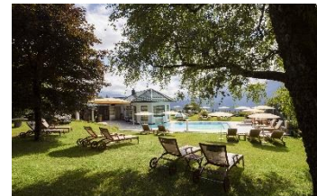
Kurhotel Vollererhof****.