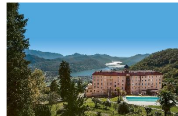
Kurhaus Cademario Hotel & Spa****s.

Wer seine Auszeit nicht nur auf Gewichtsreduktion, sondern vielmehr auf Entspannung mit bewusster Ernährung und Bewegung setzen möchte, findet im Kurhaus Cademario Hotel & Spa****s sein Dorado. In exklusiver Lage in den Bergen und Aussicht auf den Luganer See, beeindruckt das traditionsreiche Haus mit viel Ruhe, einem drei Hektar großen Park und dem „DOT.Spa“ auf über 2.000 Quadratmetern. Beim ausgiebigen Bewegungsprogramm mit Yoga, Pilates, Aqua-Gym und Fitness bringen sich Gäste in Shape.