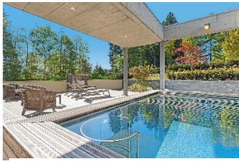
Oberwaid Das Hotel. Die Klinik. ****s.

konzentriert sich das erfahrene Ärzte- und Therapeutenteam darauf, seinen Gästen einen leichteren Umgang mit Stress und eine neue Selbstwahrnehmung zu ermöglichen, da diese Faktoren häufiger Auslöser für Übergewicht sind. Mit Hilfe eines individuellen Ernährungs- und Bewegungsplans sowie nachhaltiger Ernährungsumstellung sollen die verlorenen Kilos langfristig gehalten werden. Die Kur basiert auf den drei Säulen Ernährung, Bewegung und Motivation.