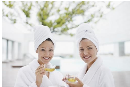
Entspannt und Schlank im Urlaub – Hotels mit Weightloss-Programmen machen es möglich.

Frankfurt, 15. Juni 2020. Geschlossene Fitnessstudios, Bewegungsmangel im Homeoffice und viel Freizeit, um es sich mit einer Tüte Chips auf der Couch gemütlich zu machen – dass sich die #StayHome-Zeit während Corona auch auf der Waage bemerkbar macht, ist bekannt.