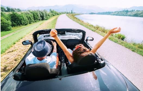
Bei einem Roadtrip lassen sich die schönsten Ecken Deutschlands entdecken.

Leipzig, 26. Mai 2020. Corona beschert uns einen Sommerurlaub unweit der eigenen Haustür – die perfekte Gelegenheit, um endlich all die schönen Ecken kennenzulernen, die Deutschland zu bieten hat. Am besten geht das bei einem Roadtrip – flexibles „Stop-and-go“ und den nötigen Sicherheitsabstand wahren geht so kaum schöner.