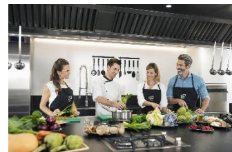
Gemeinsamer Kochkurs in der SHA Wellness Clinic.

Eines der gefragtesten Angebote von SHA ist die individualisierte Entgiftungskur, um mehr Energie und Wohlbefinden zu erhalten. Nach der medizinischen Eingangsanalyse mit Labor- und Oxidative-Stress-Test erfolgt ein Rundpaket mit Ernährungsberatung, regenerativen und revitalisierenden Medizin Konsultationen, bioenergetische Anwendung, Colon-Hydro- oder Negativ-Ionen-Therapie, Lunge-Entgiftung-Sitzung, Leber Detox, entgiftenden Massagen und Lymphdrainagen. Ebenfalls inkludiert sind die Benutzung des Außenpools, des Hydrotherapie-Bereichs und die Teilnahme an Aktivitäten im SHA Life Learning Center mit Aquagymnastik, Yoga, Meditation, Makrobiotischen Kochkursen und Vorträgen. Bei Fit Reisen buchbar ist das Programm „ SHA Detox “ ab sieben Nächten in der Suite mit Detox-Vollpension und Programm nach Behandlungsplan ab 4.683 Euro pro Person.