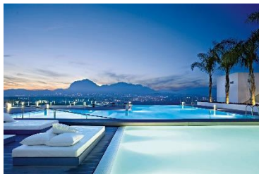
Die SHA Wellness Clinic in Alicante.

Frankfurt, 07. August 2019. Viele Menschen sehen ihre ganzheitliche Gesundheit als Statussymbol der heutigen Zeit, in die gerne investiert wird, um ein langes und glückliches Leben zu führen. Wer bewusst seinen Urlaub nutzt, um sich gesünder, vitaler und auch jünger zu fühlen, für den eignen sich Medical Wellness Kliniken, die mit neuesten Techniken das ganzheitliche Wohlbefinden des Gastes fördern. Einen Einblick