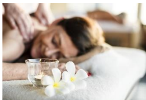
Aromatherapien mit Fit Reisen.

Frankfurt, 13. März 2019. Ob der Duft vom frischen Heu, wohltuendem Lavendel oder spritzigen Zitrusfrüchten – angenehme Gerüche können nachweislich das Wohlbefinden von Körper und Geist steigern, geben dem Immunsystem neue Kraft und tragen sogar zur Linderung von Krankheiten bei. In der Naturheilkunde kommen ätherische Öle schon lange zum Einsatz,