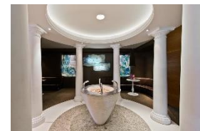
Entspannung im SPA VILNIUS Druskininkai****.

Im ältesten Kurort Litauens Druskininkai liegt das SPA VILNIUS Druskininkai**** . Mit Buchung des Programms „ Dem Burn-out vorbeugen “ erhalten Gäste neben zahlreichen Wellness- und Sport-Anwendungen eine Bernstein-Aroma-Musiktherapie. Bernstein wirkt sich bei Erwärmung positiv auf die menschliche Energie und die Atemwege aus, die Kombination aus Musik und Duftstoffen wirkt stresslindernd. Fünf Nächte im Doppelzimmer Standard mit Halbpension sind ab 450 Euro pro Person buchbar.