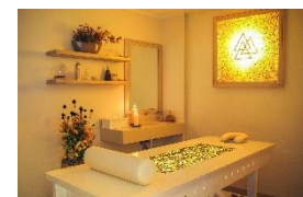
Behandlungsraum im Medical Spa Egles sanatorija Birštonas.

Eine „ Schnupperkur “ in jeglicher Hinsicht bietet das Medical Spa Egles sanatorija Birštonas in Südlitauen. Bei einem dreitägigen Aufenthalt erhalten Gäste hier einen Einblick in litauische Kuren und individuelle Kurpläne mit täglich drei Anwendungen, unter anderem auch Aromatherapien. Ätherische Öle wirken mit Hilfe von Bädern, Massagen, Kompressen und Packungen über Haut und Nase positiv auf die Gesundheit. Außerdem verfügt das Hotel über eine Salzgrotte mit ionisierter Luft mit Mineralien, welche eine heilende Wirkung für die Atemwege, Schilddrüse und auch Hautkrankheiten bereithält. Drei Nächte im Doppelzimmer Comfort mit Vollpension und ärztlicher Betreuung sind ab 189 Euro pro Person buchbar.