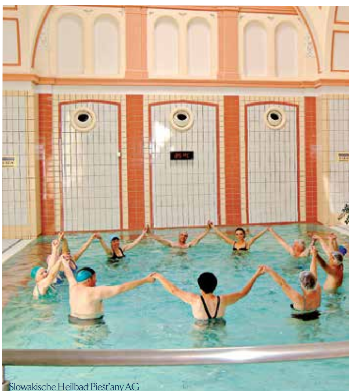
Slowakische Heilbad Piešťany AG

Störungen der Regulation des Wasser- und Salzhaushalts, Magen-Darm-Geschwüre, Pylorusstenose, Verschlussikterus, Gallensteinleiden, entzündliche Erkrankungen im Magen-Darm-Bereich, bei Vorliegen von Myomen oder malignen Tumoren.