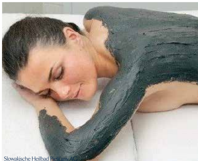
Slowakische Heilbad Piešťany AČP

Metalle, (Herz-)Schrittmacher, Herzrhythmusstörungen, fehlende Oberflächensensibilität, Hautdefekte, Allergien, Entzündungen, Verbrennungen, Thrombosen, Durchblutungsstörungen, Fieber, Schwangerschaft, akute Infekte.