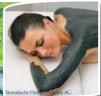
Slowakische Heilbad Piešťany AG