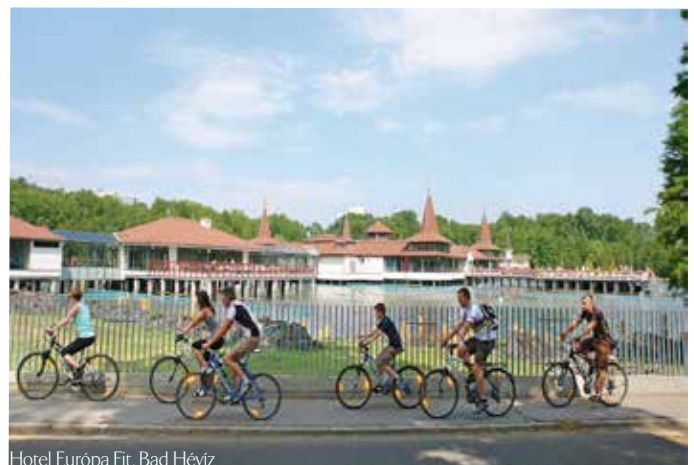
Hotel Európa Fit, Bad Hévíz

Weitere Sehenswürdigkeiten sind der Berg Badacsony - ein erloschener Vulkan in Form einer Glocke - oder der Ort Tapolca mit seiner vulkanischen Landschaft und dem bekannten dreistöckigen Höhlensystem. Auch das Herender Porzellan mit der Porzellanmanufaktur und dem Porzellanmuseum in Herend-Tihany-Balatonfüred sind einen Ausflug wert. In Keszthely kann das drittgrößte und eines der schönsten Schlösser Ungarns „Schloss Festetics“ bestaunt werden. Auch die Franziskanerkirche, das Georgikon Meierhofmuseum, das Kis-Balaton-Haus und das buddhistische Heiligtum Zalaszántó sind einen Besuch wert.