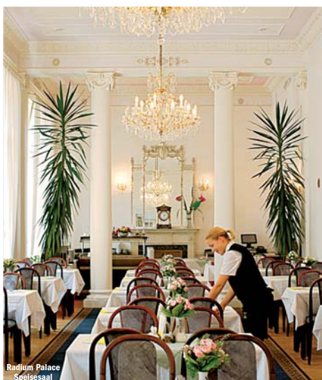
Radium Palace Speisesaal