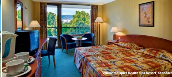
Zimmerbeispiel Health Spa Resort, Standard