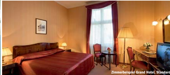
Zimmerbeispiel Grand Hotel, Standard