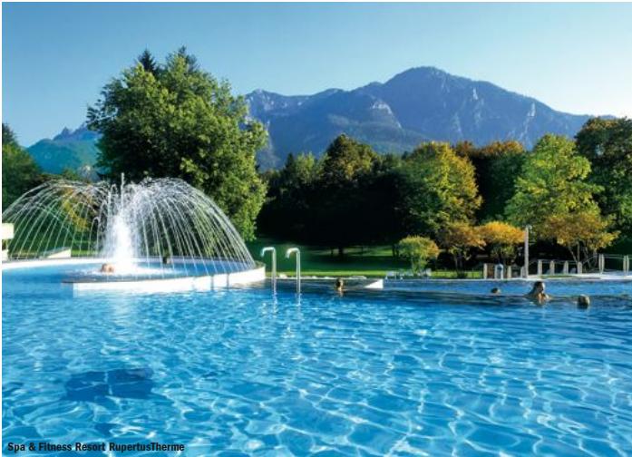
Spa &amp; Fitness Resort RupertusTherme