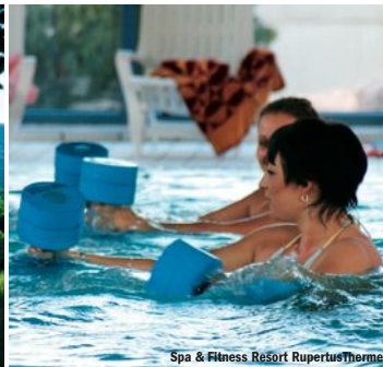
Spa &amp; Fitness Resort RupertusTherme